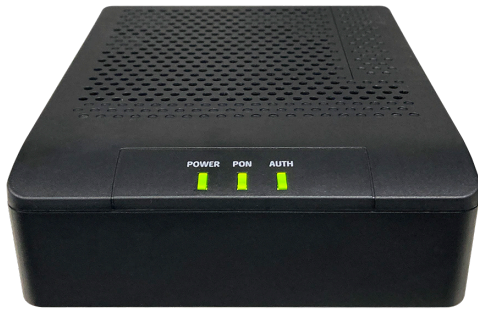
前面 (正常時のランプ状態)