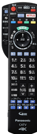
TZ-LS500B / TZ-HT3500BW (標準機) (5<5<録画)